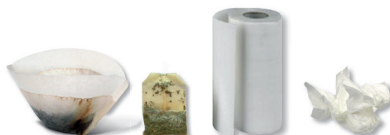
Marc de café - Sachets de thé Serviettes en papier

Mettre les biodéchets dans un sac biodégradable