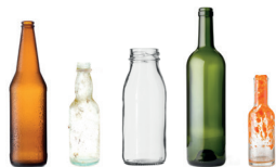
Bouteilles en verre Bocaux